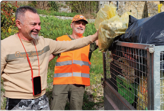
Les chasseurs de la Vallée du Jabron aiment la nature