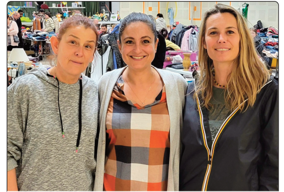
Depuis 2014 la Mam à Moi accueille les petits Sisteronais