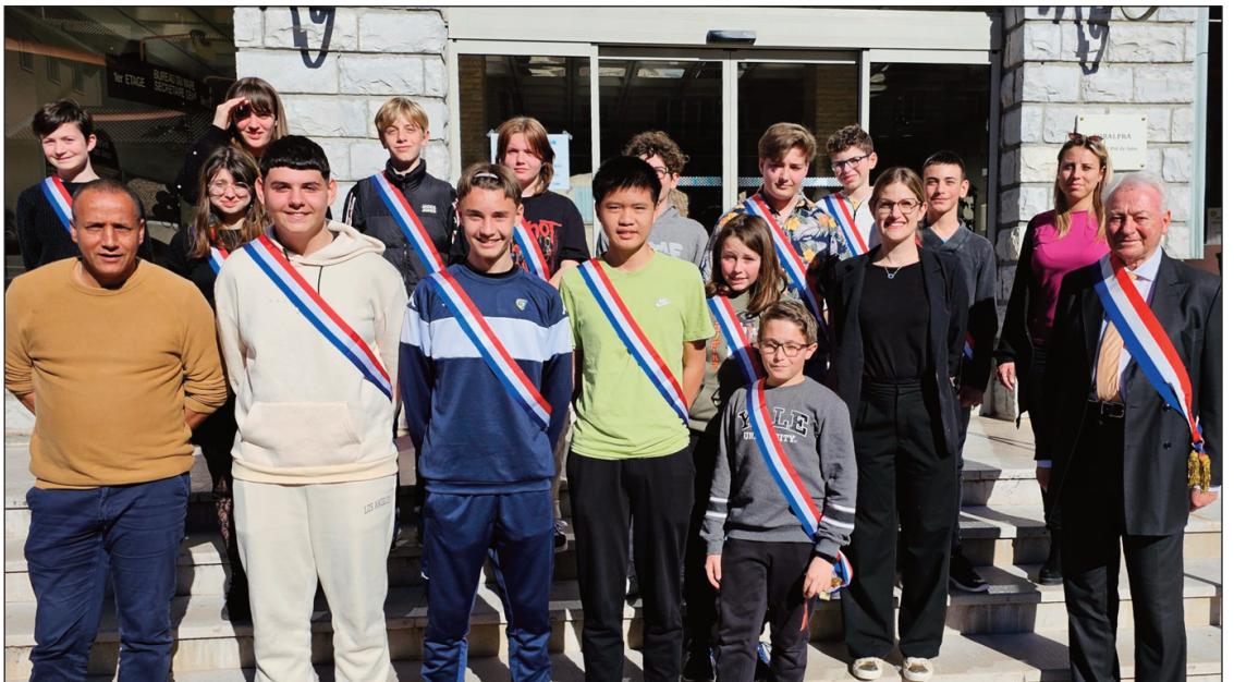
14 adolescents pleins de projets pour Sisteron

04 92 61 31 32 44 av. Jean Jaurès 04200 SISTERON