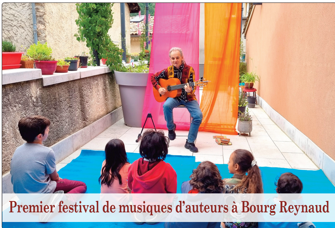
Premier festival de musiques d'auteurs à Bourg Reynaud