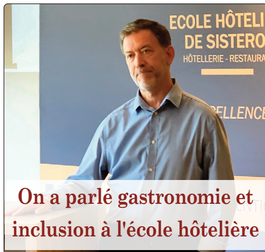
On a parlé gastronomie et inclusion à l'école hôtelière