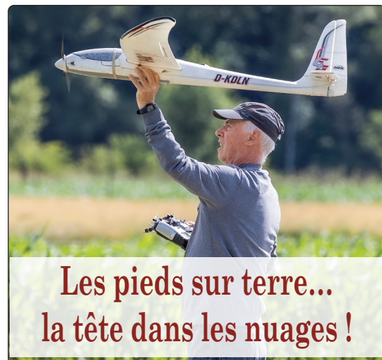
Les pieds sur terre... la tête dans les nuages !